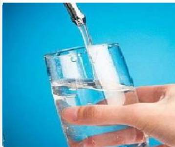
مدیریت بازار خدمات آب و فاضلاب

با کلیک بر روی هر سرفصل، می توانید گزاره های مربوطه را مشاهده نموده و سپس مورد قضاوت قرار دهید.