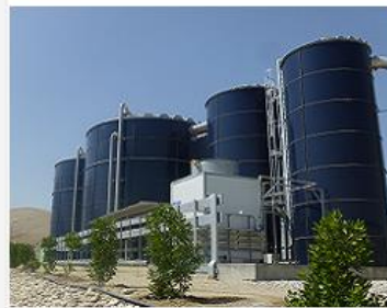
توسعه زیرساخت های صنعت آب و فاضلاب (فنی و مهندسی)