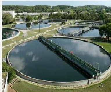
بهره برداری آب و فاضلاب